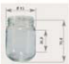
125 g std st gob 100 to48 le pack de 45

Éditer 10,80 € 12,96 € 118,80 € 142,56 €